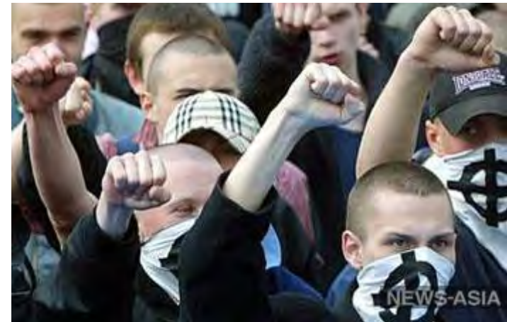
В Костроме скинхеды напали на неформалов