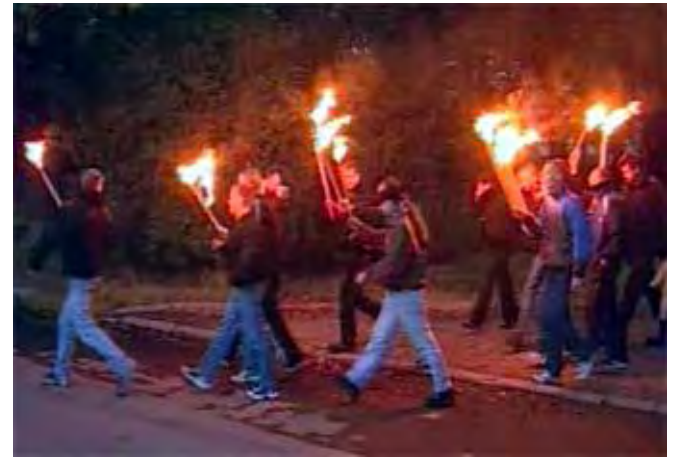
Скинхеды. Факельное шествие в Петербурге.